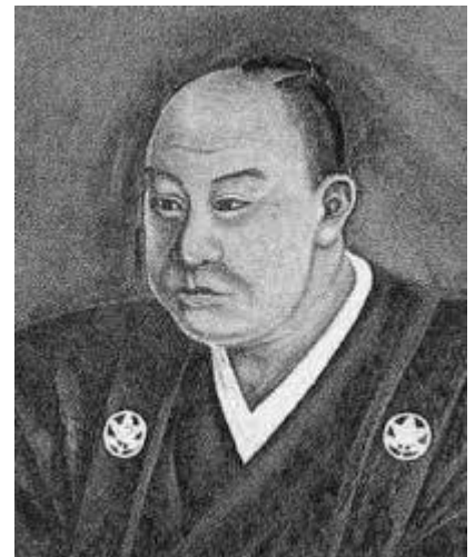
井伊直弼の肖像画

また病弱の第13代将軍徳川家定の後継をめぐり、水戸藩を血筋とし改革派が推す一橋慶喜(後の第15代将軍徳川慶喜)と徳川宗家と血筋が濃い保守派の推す紀州藩主徳川慶福(後の第14代将軍徳川家茂)の2派にわかれた跡目騒動が勃発しますが、井伊直弼の推す紀州藩主徳川慶福が安政5年(1858)第14代将軍に就任します。