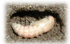
ホタルの蛹(さなぎ)