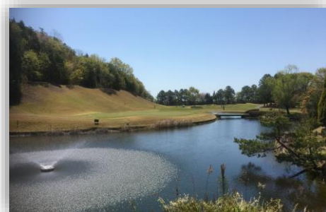
景観のすばらしい 18 番ホール

問合せ先 アオノゴルフコース・グラウンドゴルフ場 0790-45-1556 アオノスポーツホテル・アオノテニスクラブ 0790-45-1845