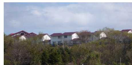
アオノスポーツホテル遠景