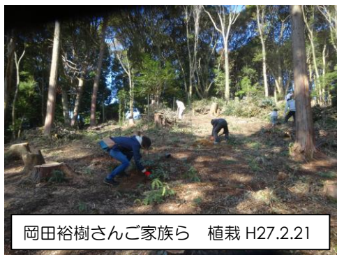
岡田裕樹さんご家族ら 植栽 H27.2.21