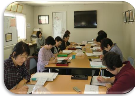
小筆教室受講風景

お友達とのおしゃべりに花を咲かせ楽しいひと時をいかがですか。ちょっと美味しいサイフォンコーヒーとケーキを用意してお待ちしています。